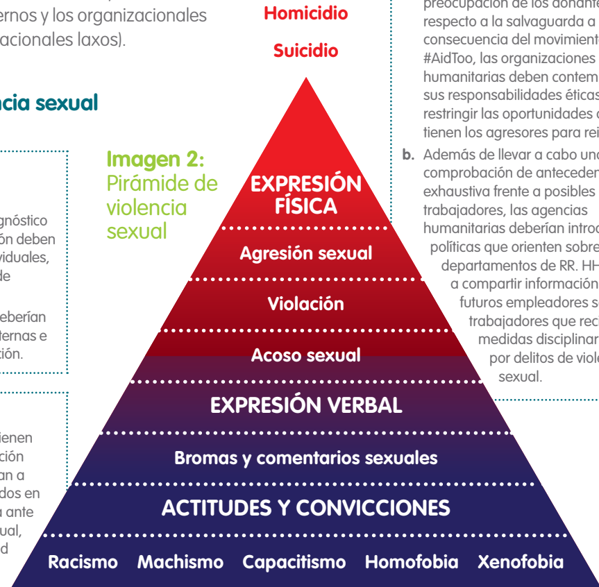
Imagen 2: Pirámide de violencia sexual